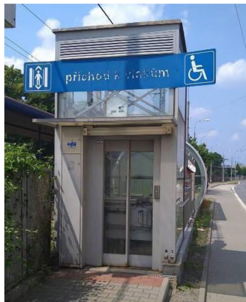
SO 01 - foto současného stavu – šachta v podchodu a na terénu k ulici Stodolní