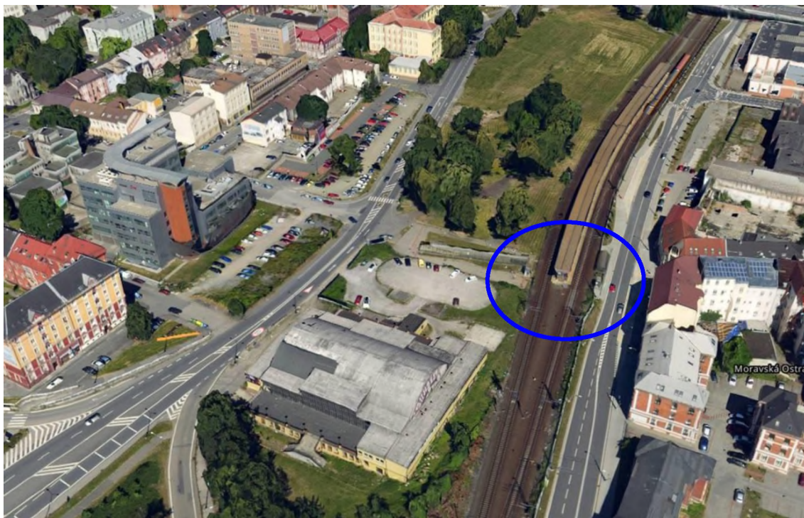
Letecké foto s označeným místem stavby

Z důvodu nepřetržitého železničního na dotčené trati bude nutné při realizaci tuto skutečnost respektovat a přijmout odpovídající dočasná opatření pro bezpečnosti provozu dráhy, bezpečnosti zaměstnanců železnice a cestujících veřejnosti, jakož i pracovníků zhotovitele stavby.