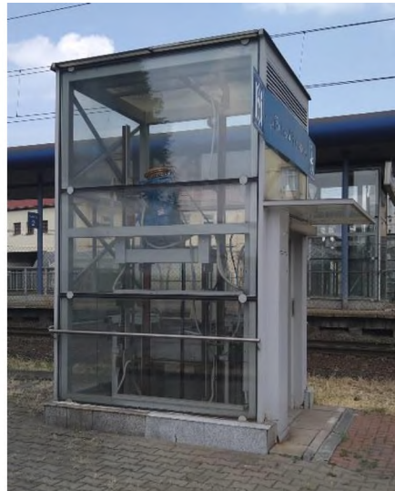
SO 03 - foto současného stavu – šachta v podchodu a na terénu k ulici Cingrova