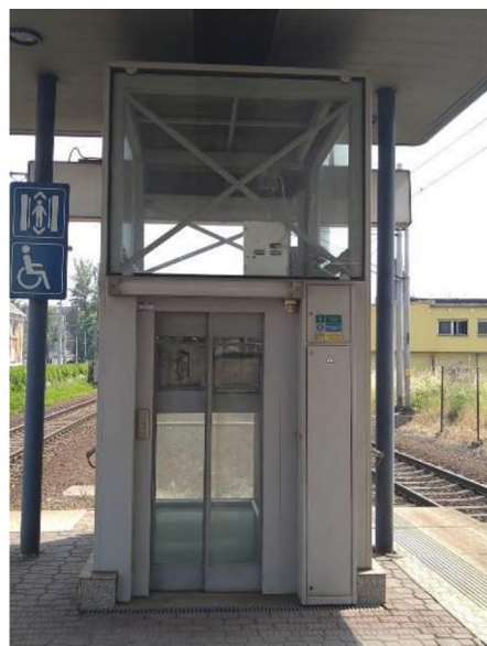
SO 02 - foto současného stavu – šachta v podchodu a na terénu - nástupiště